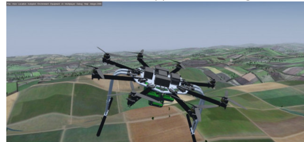
Drone di supporto logistico, sviluppato per la catena di approvvigionamento militare.

Israele usa la cultura la scienza e le arti per ripulire la propria immagine e per distrarre l'attenzione dalle politiche di occupazione, di colonialismo e di apartheid. Il Technion è l'istituzione israeliana più rinomata per le scienze applicate e svolge attività di ricerca e sviluppo in tecnologie militari , su cui le forze di sicurezza