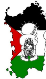
Associazione Amicizia Sardegna Palestina

Vuoi aiutarci? Ci vediamo ogni giovedì a Cagliari in Via Montesanto 28 alle 20,30. Vuoi fare una donazione? IBAN : IT-86-D07601-04800-000012907085 Vuoi sostenere il progetto Handala va a scuola? Aggiungi all'IBAN il motivo della donazione. Vuoi dare il 5 per mille? CF: 92084790929